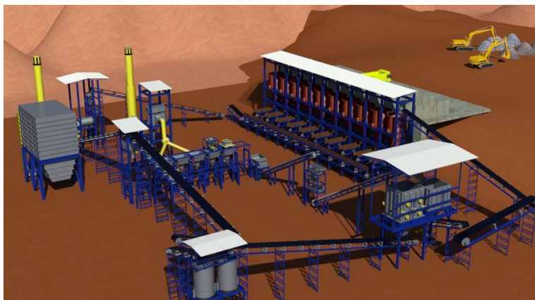
Fig: Layout Orientativo Mini Sinterização THI/Agglotek

Para poder oferecer ao mercado soluções otimizadas, além de contar com sua forte estrutura de engenharia no Brasil e do grupo KKG, a Kuttner do Brasil assinou um acordo com as empresas THI e Agglotek para o desenvolvimento técnico e comercial de Sistemas de Sinterização.