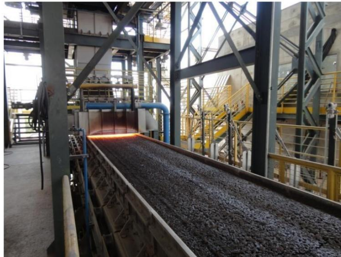
Figura 3. Sinterização Contínua Agglotek

desenvolve com o avanço da velocidade do material no forno de ignição, possibilitando, assim, um processo contínuo. A queima inicia-se na superfície até atingir todas as camadas da mistura, assim como no processo semi-contínuo.