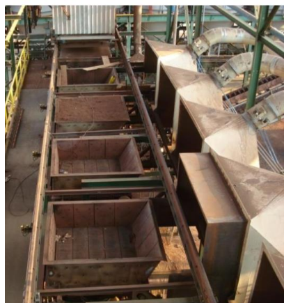
Figura 2. Sinterização Semi-contínua Agglotek

O forno de ignição é móvel, dando início à queima em cada panela. A frente de queima avança da superfície até a parte inferior, quando então a temperatura dos gases de exaustão atinge o seu valor máximo e em seguida tem-se o início da redução da mesma, indicando a finalização do processo.