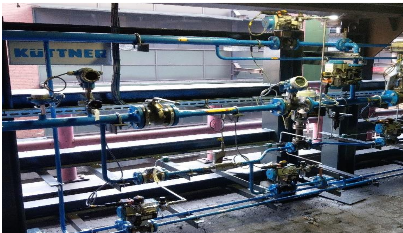
Fig. 1 Rack de Controle do Sistema de Injeção de H 2

A Planta de Injeção de Hidrogênio foi instalada no Alto Forno 9 da Siderúrgica ThyssenKrupp em Duisburg, operando em conjunto com outra pioneira e patentada tecnologia “Reactive Oxycoal Küttner”.