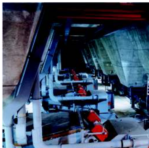
ThyssenKrupp Steel, Duisburg/ Alemanha

Planta completa de minisinterização para ferro manganês