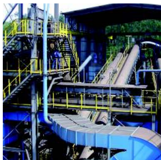
Rio Doce Manganês, Simões Filho/BA, Brasil

Unidade de britagem e peneiramento interligado aos pátios de homogeneização e plantas de sinterização