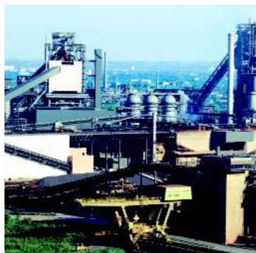
ThyssenKrupp Steel, Duisburg/ Alemanha

Os componentes principais de preparação de carga para o alto-forno são os silos de estocagem, as estações de peneiramento para os diversos tipos de matérias-primas e os silos de pesagem com sistema de calibragem. Por meio destes dispositivos são disponibilizados os diversos insumos necessários, observando-se as frações granulométricas adequadas. A preparação da carga e o manuseio até o topo do alto-forno ocorre de forma automatizada utilizando um sistema de controle de processo. A KUTTNER fornece sistemas de carregamento do alto-forno via transportador de correia ou via elevadores inclinados.